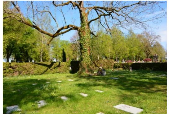
Naturbelassen und pflegefrei: das Liegesteinbaumfeld

Bei dieser Bestattungsform handelt es sich um ein Wahlgrab für maximal zwei Urnen. Die Ruhezeit beträgt 20 Jahre, mit der Option der Verlängerung.