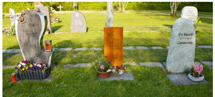
Das Erdwahl- oder Urnenwahasengrab – pflegeleicht und individuell

Merkmale dieser Grabvarianten sind eine Grabbeetfläche, die als Rasenfläche angelegt ist, und eine Grundplatte, die sich direkt am stehenden Grabmal befindet. Auf der Grundplatte können Blumenschmuck in Pflanzschalen und Vasen abgelegt werden. Seitliche Grabeinfassungen sind nicht vorgesehen.