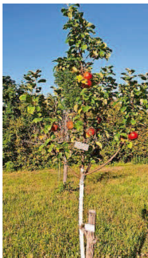
Patenbaum am Olber

Die Bürgergemeinschaft DingelsDorfLeben e.V. konnte erneut im Gewann Hegenhalde Wiesen von der Stadt Konstanz pachten. Auch hier sollen wieder Streuobstwiesen mit Patenbäumen entstehen.