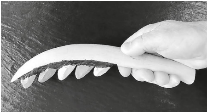
Rekonstruktion einer Sichel aus der Pfahlbauzeit

Unsere sesshaften Vorfahren bauten auf kleinparzelligen Feldern ein reichhaltiges Spektrum an Kulturpflanzen an. Es war sicherlich ein idyllisches Bild, im Umfeld des Dorfes, die bestellten, in allen Farben üppig blühenden Felder zu sehen. Hier wuchsen Lein, Klatschmohn, Kornblume, verschiedene Getreidearten wie Emmer, Dinkel, Einkorn, Gerste, Nacktweizen und Kolbenhirse, sowie Hülsenfrüchte, wie Linsen, Ackerbohnen und Erbsen. All diese Feldfrüchte mussten geerntet werden, sie waren wichtige Nahrungsvorräte für die Wintermonate. Verschiedene Arten von Sicheln wurden dazu verwendet.