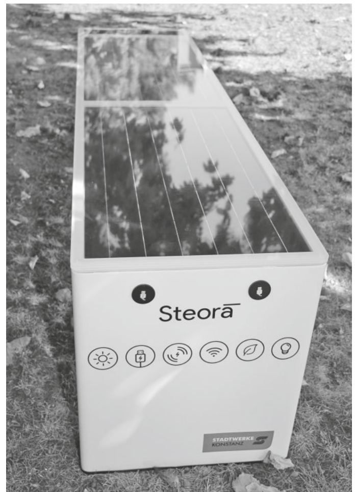
An der einen Seite befinden sich die USB-Anschlüsse.