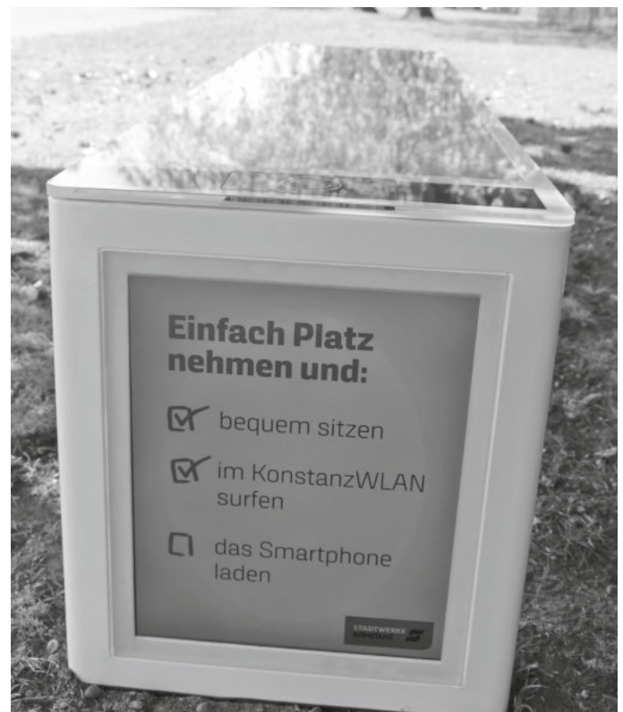
Auf dem Bildschirm können die Stadtwerke kleine Filme spielen oder Bilder zeigen. Das kabellose Laden ist am Rand der Sitzfläche möglich