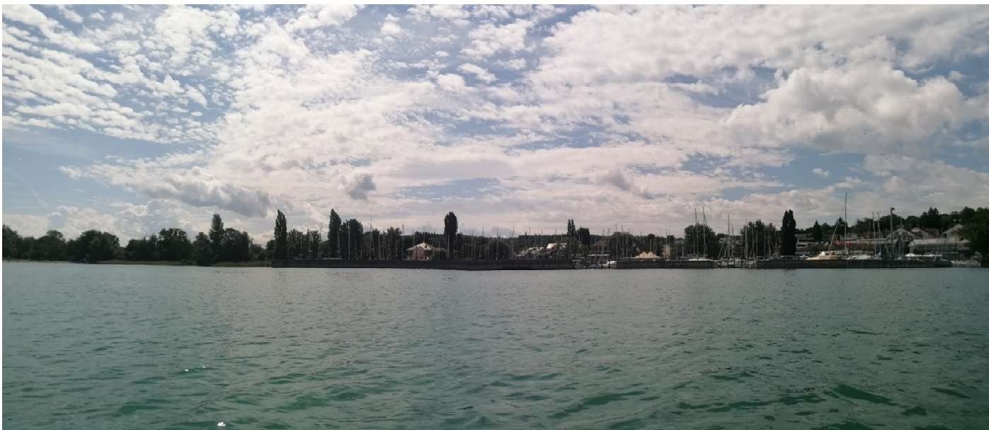
Blick auf Wallhausen