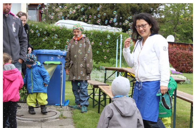
Bilder: Frau Kleinöder