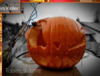
Tobias, 9 Jahre