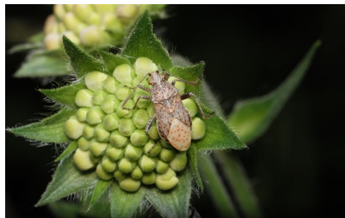
Käfer - auf einer Blüte, die noch aufgehen muss

Konstanz mit seinen Vororten hat so einiges zu bieten... Alle aktuellen Veranstaltungen wie Konzerte, Theater, Stadtführungen, Rad- und Wandertouren, Schifffahrten, etc. im Überblick unter: www.konstanz.de/tourismus